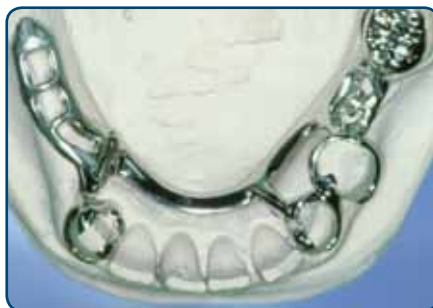
Frameprothese in wording op een gipsmodel, zonder kunsttanden en -kiezen

Bij een slotje wordt de ene kant vastgemaakt aan een kroon, tand of kies en de andere kant zit vast aan de frameprothese. De frameprothese kunt u op die manier in het slotje schuiven. Het slotje zit doorgaans aan de binnenkant van de tanden en kiezen en is dus niet vanaf de buitenkant zichtbaar. Ankertjes zijn vaak wel enigszins zichtbaar.