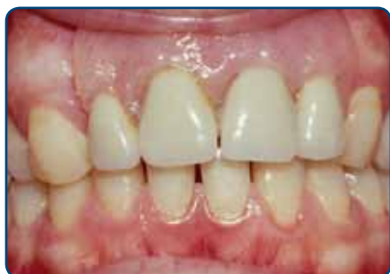
Plaatprothese van voren

De plaatprothese is gemaakt van een roze, tandvleeskleurige kunsthars. Daarin zijn de kunsttanden en -kiezen verankerd. De gehele plaatprothese rust op het slijmvlies van de mond. Deze zit eventueel met ankertjes vast aan overgebleven tanden of kiezen.