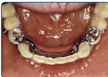
Frameprothese met verankering op kronen