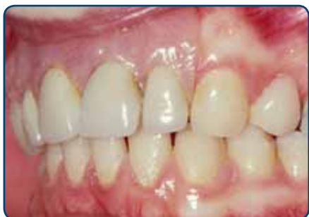
Plaatprothese van opzij