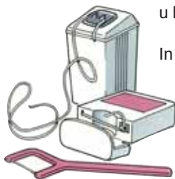
Flosshouders en flossboogje

Flossdraad is verkrijgbaar in verschillende soorten en dikten, met en zonder waslaagje. Sommige mensen gebruiken liever een flossboogje. Overleg met uw tandarts of mondhygiënist welk flossdraad u het beste kunt gebruiken.