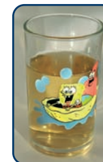
Ook appelsap is een zuur tussendoortje

Behalve goed poetsen, napoetsen en controle, is het belangrijk dat u goed op de voeding van uw kind let. Zowel suiker (gaatjes) als zuur (erosie) kunnen het gebitt beschadigen. Beperk daarom het aantal eet- en drinkmomenten tot maximaal zeven per dag. Drie keer een maaltijd en maximaal vier keer per dag een tussendoortje. Het gaat niet alleen om hoe véél zure producten uw kind eet en drinkt. Het gaat vooral om hoe vaak, hoe lang, de tijdstippen en de manier waarop dat gebeurt. Tanderosie is slijtage van het tandglazuur door zuurinwerking. Het is een sluipend proces dat niet gemakkelijk te herstellen is.