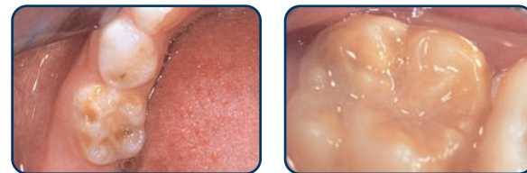
Een kaaskies in een melkgebit

Kaaskiezen zijn kiezen met plekken waarvan het glazuur minder hard is. Deze plekken zijn herkenbaar aan de geelbruine verkleuringen. Meestal treden ze op bij de eerste grote kiezen (zie foto's). De afwijking kan zich beperken tot enkele plekkjes, maar ook kan een heel vlak worden aangetast. In kaaskiezen ontstaan vaak gaatjes. Ook kunnen ze snel afbrokkelen door slijtage. Ze zijn vaak gevoelig voor koud en warm en ook zoetigheid doet vaak zeer. Kinderen met kaaskiezen vermijden daarom wel vaker zoetigheden. Denkt u dat uw kind last heeft van kaaskiezen? Neem dan contact op met uw tandarts.